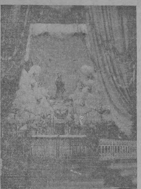
Aspecto que presentaba el interior del Templo Parroquial de Heredia durante la fiesta de la Inmaculada que se celebró en días pasados. El